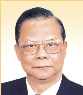
曾憲梓 Dr the Hon TSANG Hin-chi, GBM